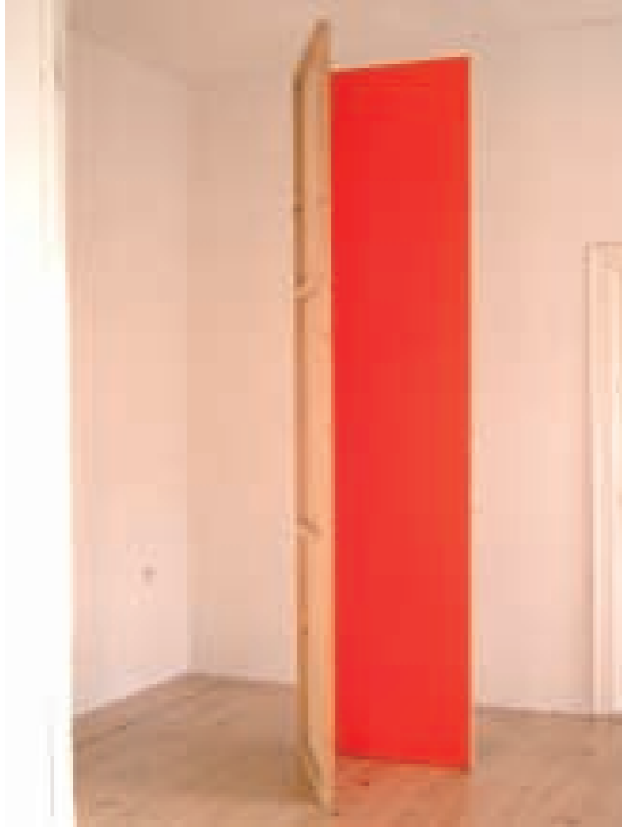
links ohne Titel, 1998 Holz, Sperrholz, lackiert, Höhe 300cm