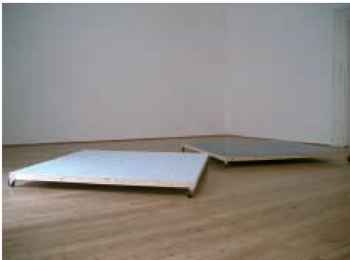
unten rechts Ausstellungsansicht "4 Millimeter", Salzburg 2003