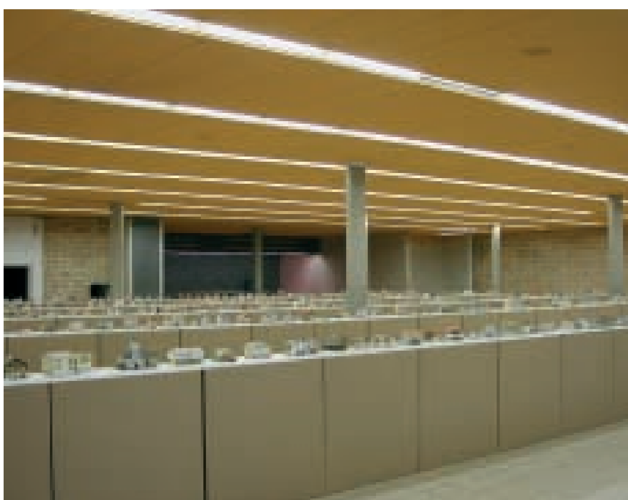
obere Reihe restmodern.de - Fotodokumentation der alltäglichen Nachkriegsmoderne in Berlin

werk, bauen + wohnen, Bauwelt, Garten + Landschaft, Jahrbuch des Deutschen Architekturmuseums, DuMonts Begriffslexikon zur zeitgenös- sischen Kunst u.a.